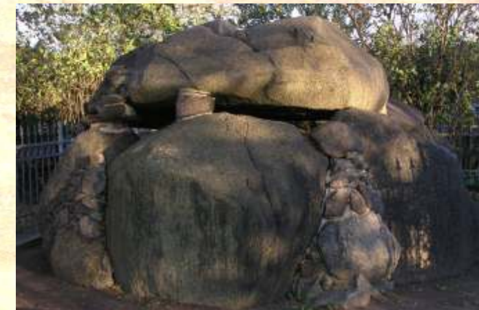
heutiger Zustand 2006

Die Funde aus dem „Heidenberg“ bildeten nach seiner Ausgrabung im Jahre 1913 den Grundstock der überregional bedeutenden prähistorischen Sammlung in Köthen. Die Gegenstände und die gesamten Fundumstände waren infolge aufgrund ihrer Einzigartigkeit häufig Gegenstand der wissenschaftlichen Diskussion. Eine Vielzahl an Veröffentlichungen mit teilweise kontroversen Auffassungen über kulturelle Zuordnung, Datierung und Bestattungsabfolge zeugen von der Bedeutung