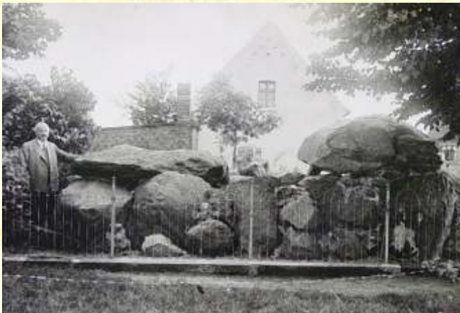
Das Grab von Norden, um 1940