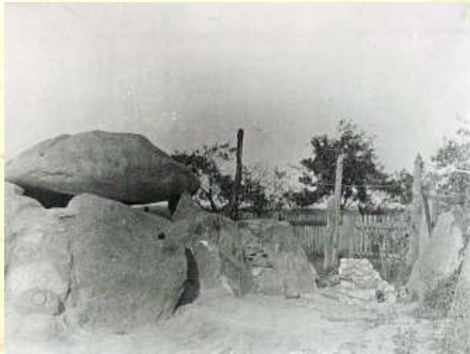
Das Grab von Südwesten nach der Ausgrabung 1913

schaftlichen Ausgrabungen, die sich häufig auf die gut sichtbaren und Erfolg versprechenden Großgrabhügel konzentrierten. Die für ihre Zeit beispielgebend sorgfältige Ausgrabung, welche vom 20. Mai bis 28. Juni 1913 stattfand, brachte erstaunliche Dinge ans Tageslicht. Der noch 22 Meter lange und 16 Meter breite Hügel wies eine Höhe von 3,50 Meter auf. Im äußeren Hügel fanden sich 11 Gräber mit Bestattungen. Es handelte sich um Erdgräber mit oder ohne Steinsetzungen und kleine Steinkisten mit jeweils einem bestatteten Individuum in Seitenlage mit angezogenen Beinen, sogenannten Hockern. In der Mitte des Heidenberges fand sich ein Großsteingrab, bestehend aus aufgerichteten Tragsteinen und drei großen Decksteinen. Der Zugang lag wahrscheinlich an der östlichen Schmalseite.